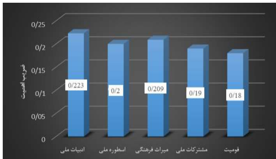
نمودار ۵. ضریب اهمیت هر یک از مقوله‌ها در واحد مضمون کتب زبان و ادبیات فارسی هشتم