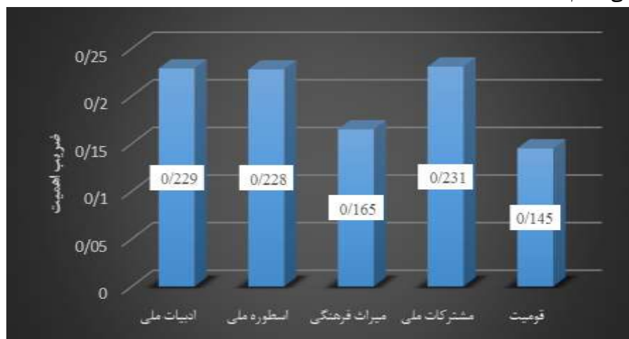
نمودار ۱. ضریب اهمیت هر یک از مقوله ها در واحد لغات کتب زبان و ادبیات فارسی هفتم

این جدول بیانگر آن است که بیشترین اهمیت به مقوله ادبیات ملی و کمترین اهمیت به مقوله قومیت در واحد لغات کتب زبان و ادبیات فارسی هفتم شده است.