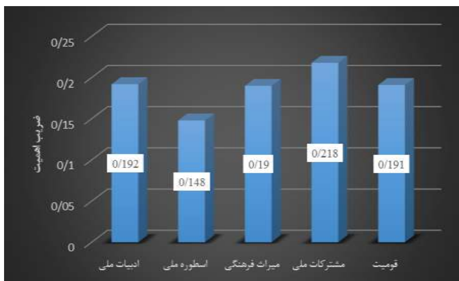
نمودار ۸. ضریب اهمیت هر یک از مقوله‌ها در واحد تصویر کتب زبان و ادبیات فارسی هشتم