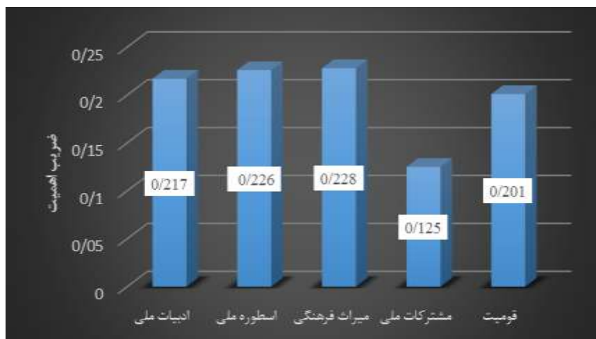
نمودار ۹. ضریب اهمیت هر یک از مقوله‌ها در واحد تصویر کتب زبان و ادبیات فارسی نهم

این جدول بیانگر آن است که بیشترین اهمیت به مقوله میراث فرهنگی و کمترین اهمیت به مقوله مشترکات ملی در واحد تصویر کتب زبان و ادبیات فارسی نهم شده است.