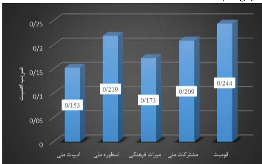
نمودار ۷. ضریب اهمیت هر یک از مقوله ها در واحد تصویر کتب زبان و ادبیات فارسی هفتم

این جدول بیانگر آن است که بیشترین اهمیت به مقوله قومیت و کمترین اهمیت به مقوله میراث فرهنگی در واحد تصویر کتب زبان و ادبیات فارسی هفتم شده است.