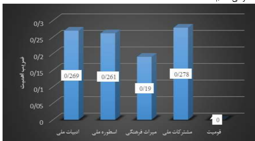
نمودار ۴. ضریب اهمیت هر یک از مقوله ها در واحد مضمون کتب زبان و ادبیات فارسی هفتم

این جدول بیانگر آن است که بیشترین اهمیت به مقوله مشارکت ملی و کمترین اهمیت به مقوله قومیت در واحد مضمون کتب زبان و ادبیات فارسی هفتم شده است.