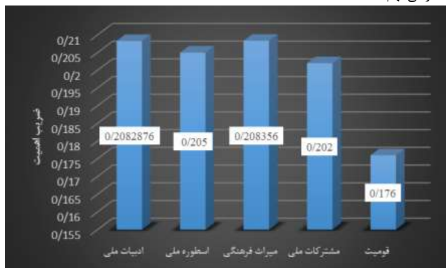
نمودار ۶. ضریب اهمیت هر یک از مقوله‌ها در واحد مضمون کتب زبان و ادبیات فارسی نهم

این جدول بیانگر آن است که بیشترین اهمیت به مقوله میراث فرهنگی و کمترین اهمیت به مقوله قومیت در واحد مضمون کتب زبان و ادبیات فارسی نهم شده است.