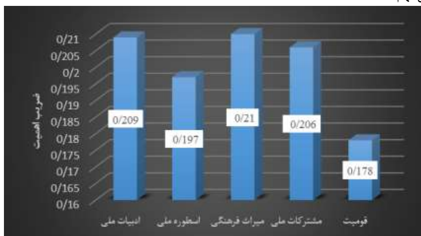
نمودار ۳. ضریب اهمیت هر یک از مقوله ها در واحد لغات کتب زبان و ادبیات فارسی نهم

این جدول بیانگر آن است که بیشترین اهمیت به مقوله میراث فرهنگی و کمترین اهمیت به مقوله قومیت در واحد لغات کتب زبان و ادبیات فارسی نهم شده است.